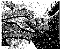
Seehotel Fischereierwerb und Fische des Seehotel Schlick

Es ist wieder so weit, ich darf bereits das 23. Internationale Hegefestchen um die Fuschsee Renke ankündigen. Wir freuen uns sehr, wieder alte Bekannte und neue Gesichter als Fischerinnen und Fischer aus Nah und Fern am Fuschsee begrüßen zu dürfen.